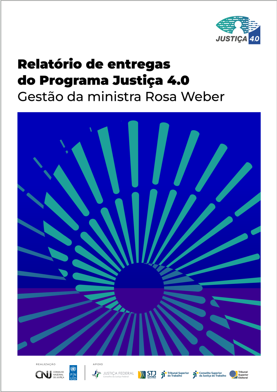
Relatório de Entregas Justiça 4.0