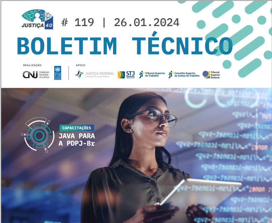
Boletim Técnico Justiça 4.0