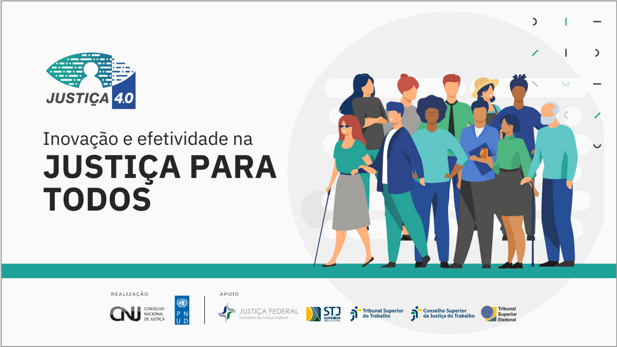
Apresentação Justiça 4.0