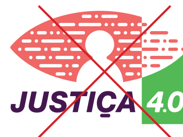
Cores não previstas