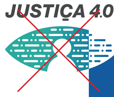
Ordem dos elementos