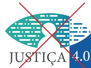
Tipografia não prevista