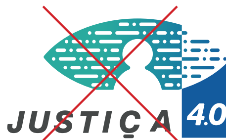
Alteração do espaçamento