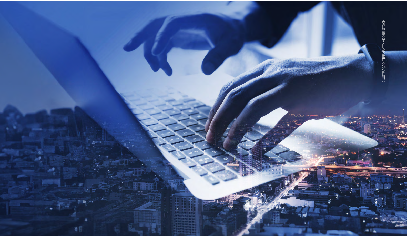
ILUSTRAÇÃO TIPPAPATTI/ADOBE STOCK