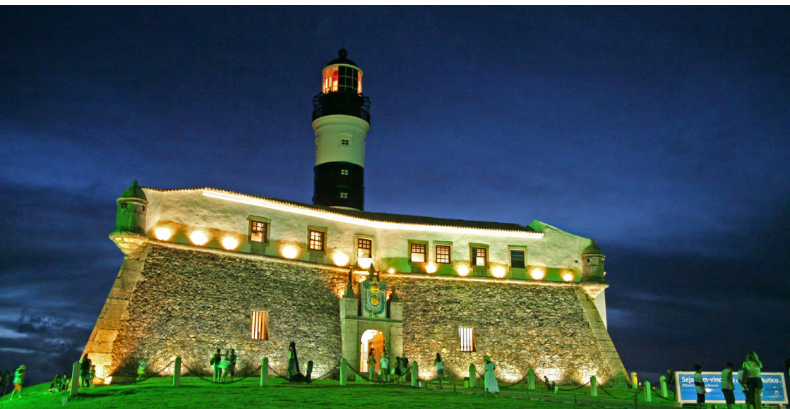
Farol da Barra, Salvador

O Farol da Barra, construído no interior do Forte de Santo Antônio da Barra, é um dos principais cartões-postais da cidade e abriga o Museu Náutico da Bahia. Aberto à visitação, o farol serve de moldura para o pôr-do-sol mais bonito de Salvador. No Carnaval, ele é ponto de partida para a folia dos trios elétricos que animam os foliões.