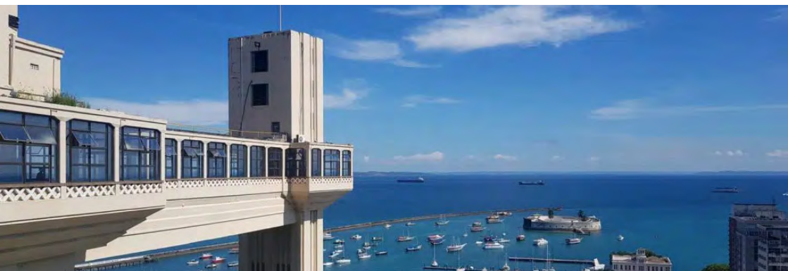
Elevador Lacerda, Salvador

Um dos principais cartões-postais da cidade. Foi o primeiro elevador urbano do mundo. Ainda hoje cumpre a função de transporte público entre a Praça Cairu, na Cidade Baixa, e a Praça Tomé de Souza, na Cidade Alta. Lá do alto, pode-se contemplar a vista da Baía de Todos os Santos, do Mercado Modelo e do Forte de São Marcelo.