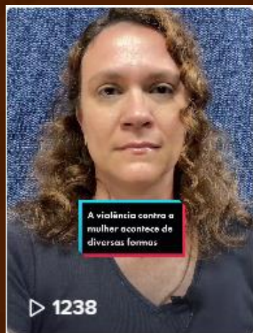
A violência contra a mul...