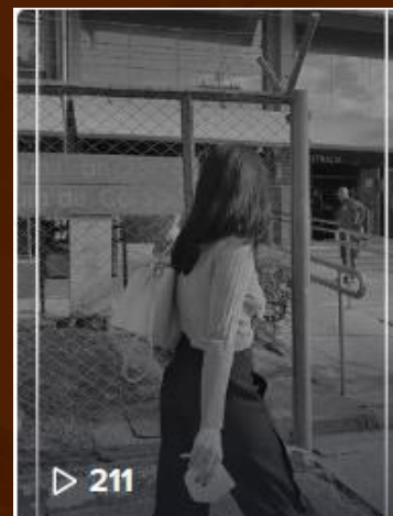
Durante duas semanas, ...