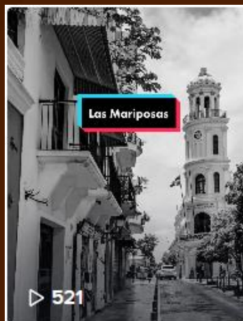
O dia 25 de novembro ...