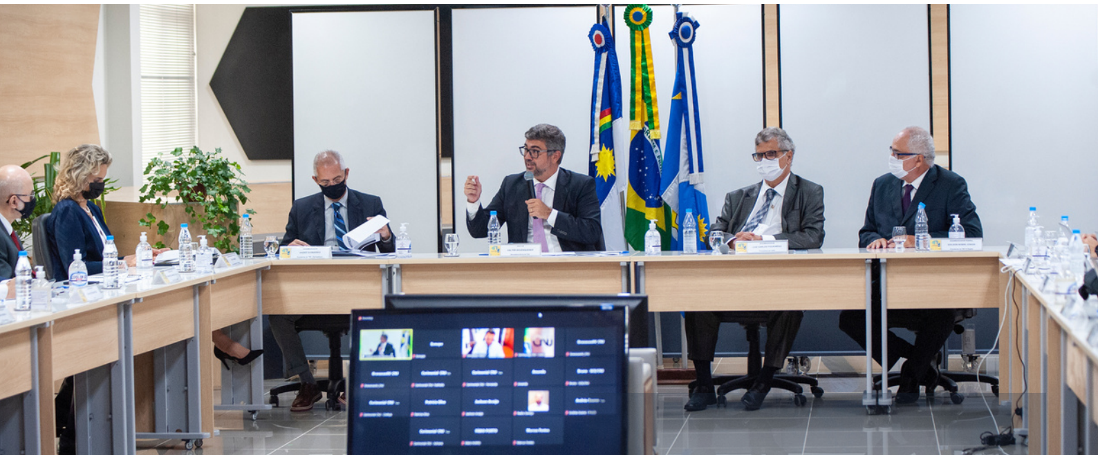
Reunião institucional do Justiça 4.0 com tribunais de Pernambuco.