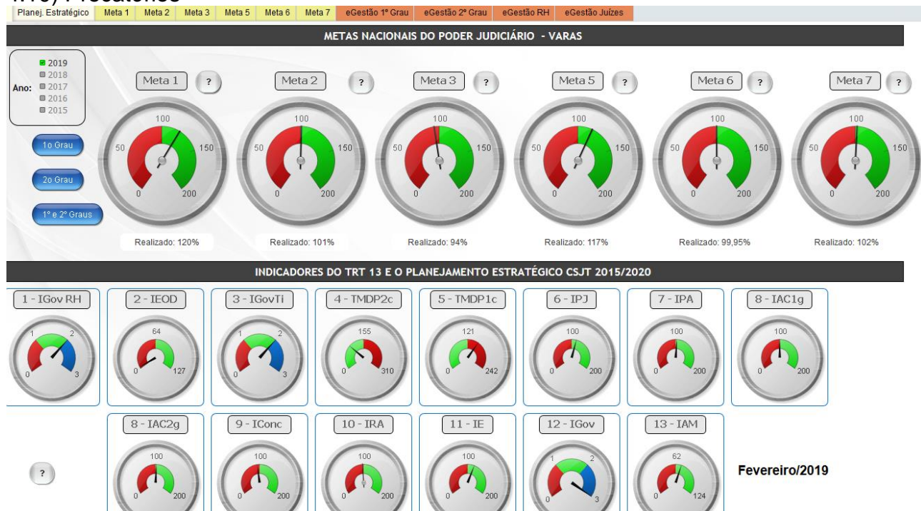
Tela com as Metas do CNJ e Planejamento Estratégico do CSJT