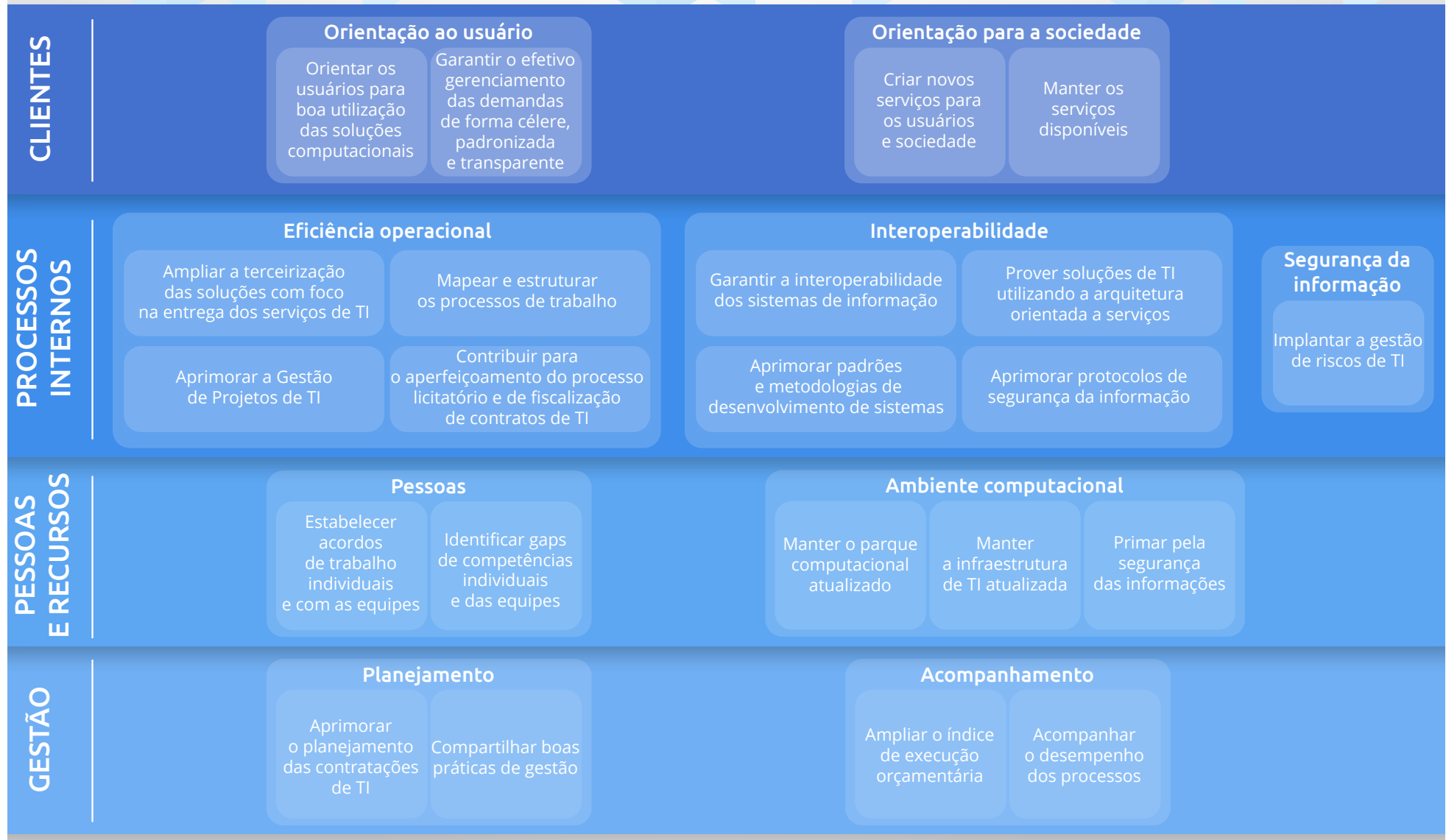
Figura 6 – Mapa tático de TI do PJSC