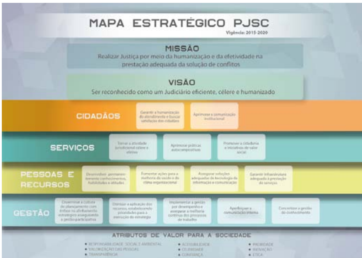
Figura 4 – Mapa estratégico do Poder Judiciário de Santa Catarina

Já a estratégia do Poder Judiciário de Santa Catarina foi instituída pela Resolução 28/2014 – TJ e está representada no seguinte mapa.