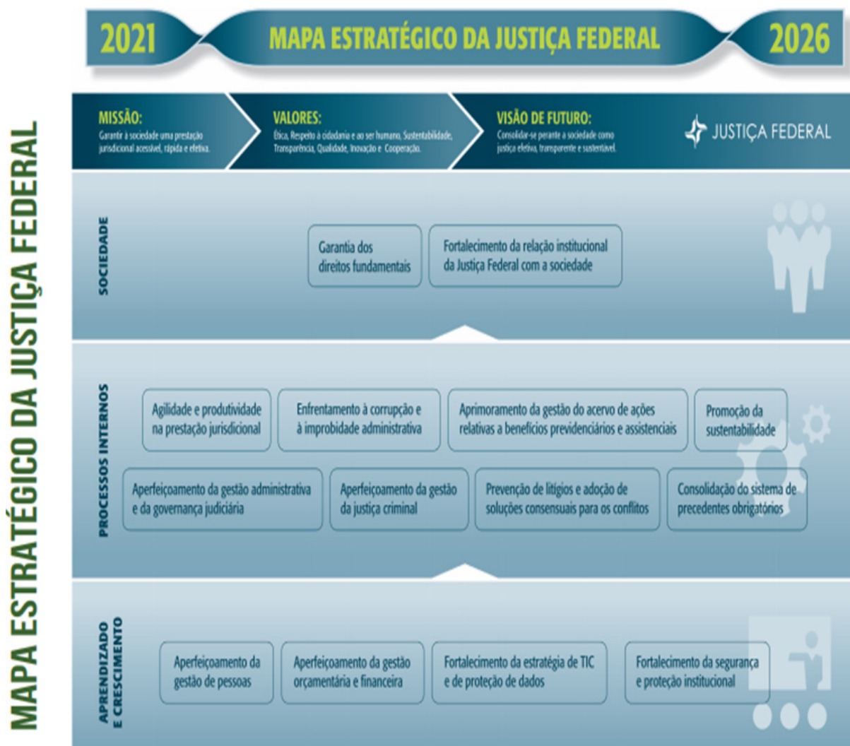
Figura 4 – Mapa do Planejamento Estratégico da Justiça Federal – 2021/2026