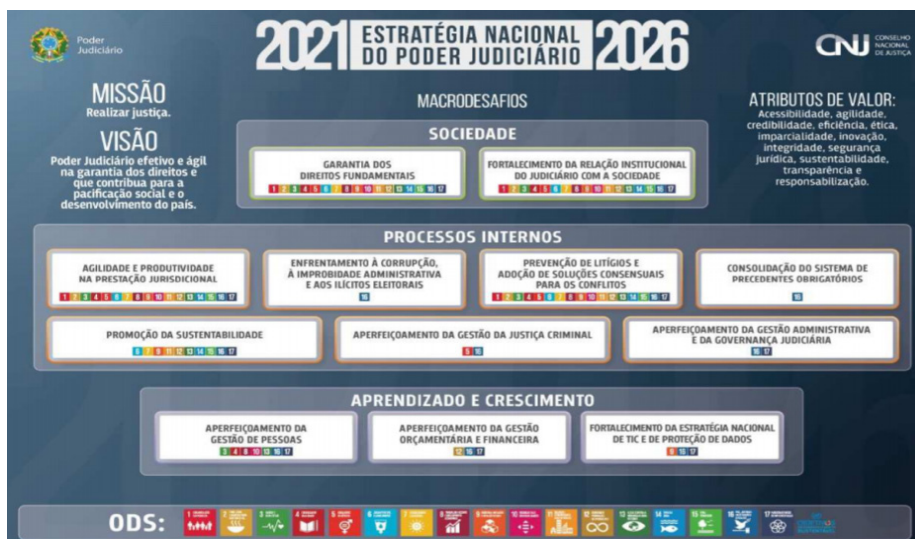
Figura 3 – Mapa Estratégico intercambiado com os ODS da Agenda 2030/ONU